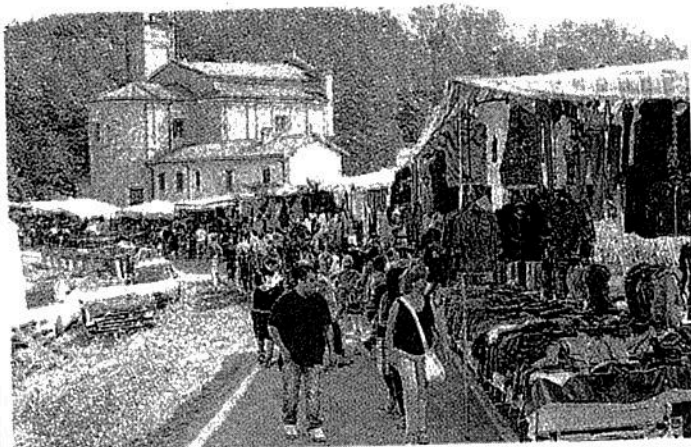
Le bancarelle della Fiera della Madonna di Rogoredo