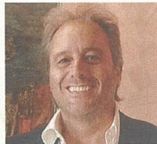
Il sindaco Massimo Gherbesi

ra - le sue parole - FieraIn è stata implementata, oltre che per sostenere i nostri commercianti, anche per creare una coscienza critica tra i consumatori. La nostra volontà è quella di far capire alla gente la qualità dell'artigianato che abbiamo. Ci saranno anche artigiani del mobile e un giovane che ha deciso di mettersi in gioco come impagliatore di sedie, riscoprendo il lavoro del nonno». Riflessione condivisa da Pontiggia, quella della fiera che punta anche a far riscoprire i lavori altrimenti scomparsi, ritornati in anni di crisi.