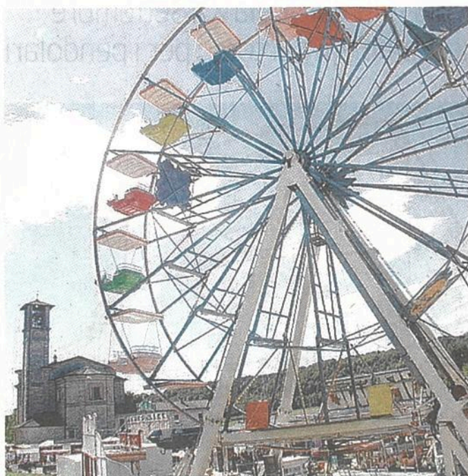
La Fiera della Madonna di Rogoredo attira migliaia di visitatori